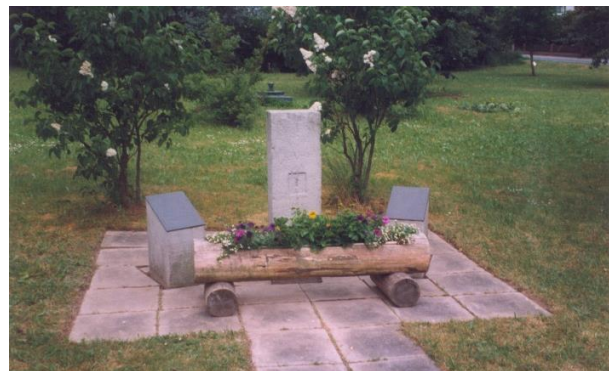
Der Friedrich-Wagner-Gedenkstein auf dem Friedrich-Wagner-Platz (1982 – 2000)

Im Jahr 2000 wurde der Gedenkstein in die Ortsmitte von Heidenrod-Kemel verlegt, da der bisherige Platz einer anderen bauplanerischen Nutzung zugeführt werden sollte. Er befindet sich nun am Heimat- und Kulturhaus („Haus Wieser“) gegenüber der Kirche, welches in unmittelbarer Nähe von Friedrich Wagners Geburtshaus liegt. Im Rahmen der feierlichen Einweihung dieses Heimat- und Kulturhauses am 12. August 2000 wurde auch die neue Friedrich-Wagner-Gedenkstätte der Öffentlichkeit vorgestellt.